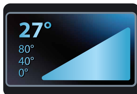
График будет обновляться непрерывно каждые 9 минут путем добавления новой точки справа.

Каждые 9 минут измеряется температура и на первой позиции ставится точка. Остальные значения сдвигаются вправо. Всего 88 точек для записи температуры. Таким образом, график полностью заполнится (или обновится) за 792 минуты. Это 13 часов 12 минут.